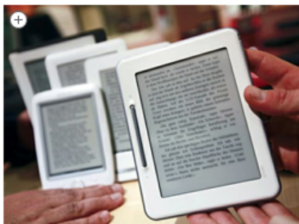
MILANO Novità digitali anche nelle biblioteche

12 maggio 2011 | Società e Costume | Commenta